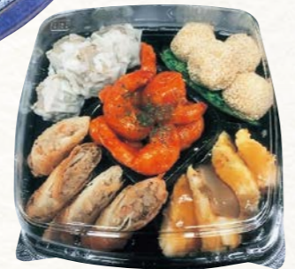
4 中華セット (1皿)