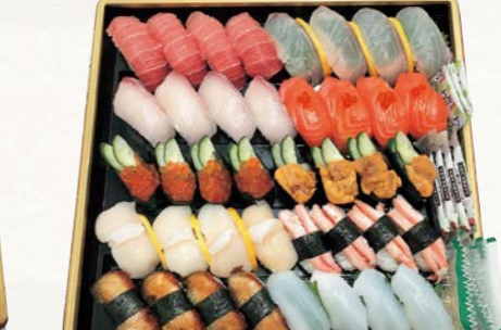
20 お魚屋さんの握り寿司盛合せ (漁火) (40貫・1パック) 4人前

本まぐろ中とろ、鯛、かんばち、サーモン、いくら、うに、貝、かに、うなぎ、いか (各4貫)