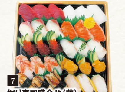
7 握り寿司盛合せ (蘭) (30貫)