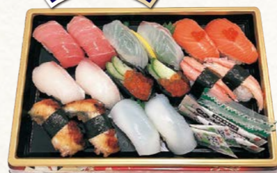
17 お魚屋さんの握り寿司盛合せ (雅) (16貫・1パック) 2人前