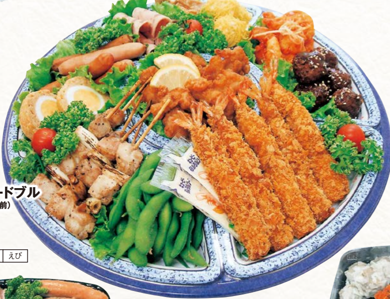
1 料理オードブル (1皿・3~4人前)

オードブル ご希望・ご予算に合わせて承ります ※季節により内容が異なる場合があります。