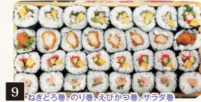
9 具沢山中巻きセット (4種盛・1パック)