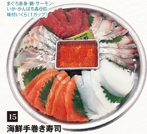
15 海鮮手巻き寿司 ネットセット (1パック) 4~5人前