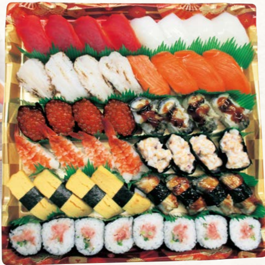
5 ファミリー寿司 (楽) (48貫)