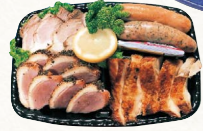
3 肉バルセット (1皿)