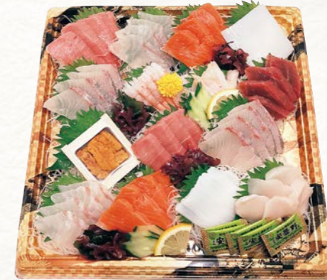
14 お刺身盛り合わせ【豊漁】 (9種15点盛・1パック) 4~5人前

本まぐろ中とろ×2、白身×2、サーモン×2、いか×2、かんばち×2、甘えび、まぐろ赤身、うに、貝×2