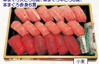
22 まぐろ尽くし握り寿司盛り合わせ (18貫・1パック) 2~3人前