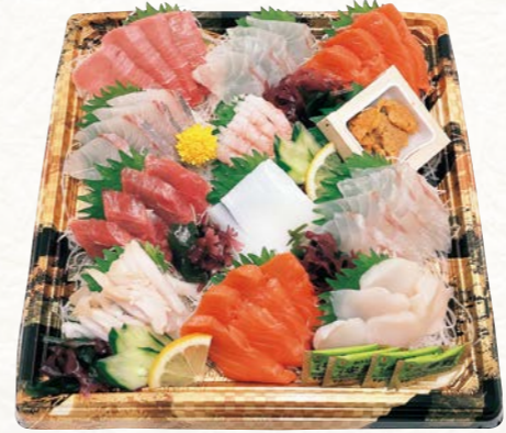
13 お刺身盛り合わせ【肴】 (9種12点盛・1パック) 4~5人前

本まぐろ中とろ、白身×2、サーモン×2、かんばち、甘えび、うに、まぐろ赤身、いか、貝×2