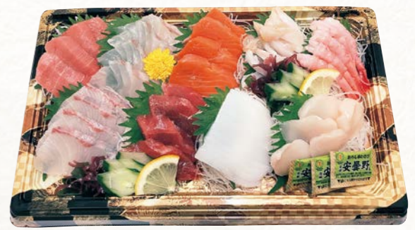
12 お刺身盛り合わせ【宴】 (8種9点盛・1パック) 3~4人前