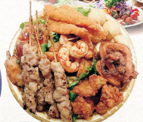
2 おつまみセット (1皿)