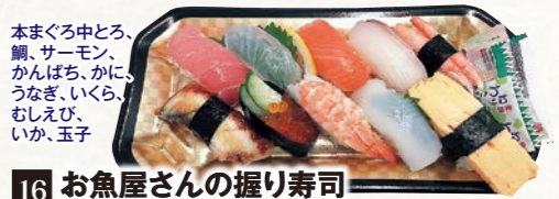
16 お魚屋さんの握り寿司盛合せ (10貫・1パック) 1人前

本まぐろ中とろ、鯛、サーモン、かんばち、かに、うなぎ、いくら、むしえび、いか、玉子