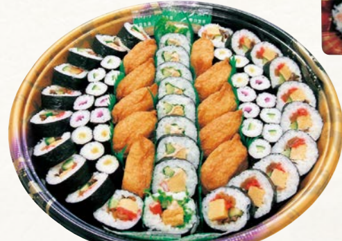
8 巻寿司盛合せ (あやめ) (1皿)