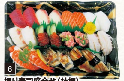
6 握り寿司盛合せ (桔梗) (22貫)