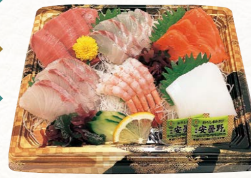
11 お刺身盛り合わせ【華】 (6種6点盛・1パック) 2~3人前