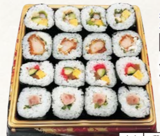
10 具沢山中巻きセット (ハーフセット) (4種盛・1パック)