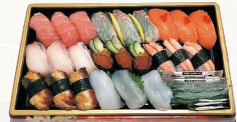
18 お魚屋さんの握り寿司盛合せ (煌) (24貫・1パック) 2人前