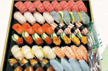
21 お魚屋さんの握り寿司盛合せ (大漁) (48貫・1パック) 5人前

本まぐろ中とろ (8貫)、かんばち、鯛、サーモン、かに、いくら、うに、貝、むしえび、うなぎ、いか (各4貫)