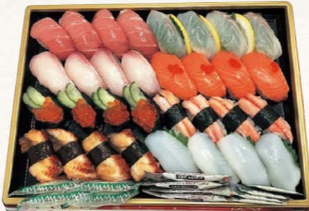
19 お魚屋さんの握り寿司盛合せ (輝) (32貫・1パック) 3人前